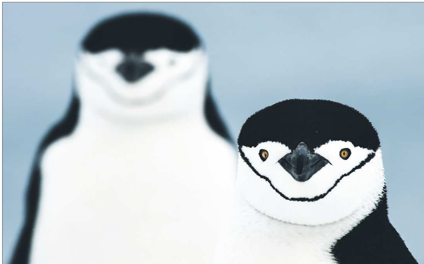
Пингвины очень редко смотрят прямо в камеру, поэтому фотографу пришлось очень долго выжидать момент, чтобы сделать этот редкий снимок