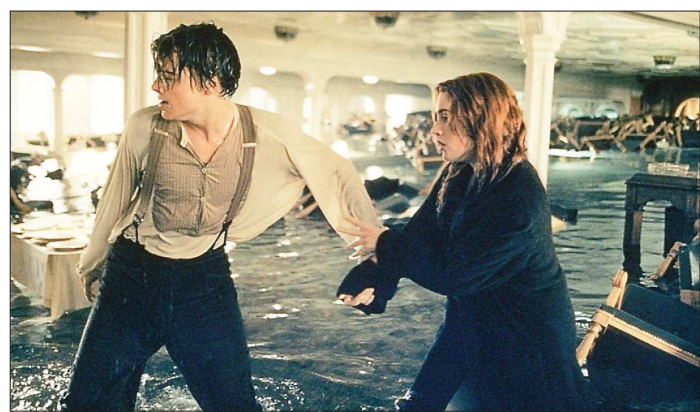
Кадр из фильма «Титаник»...