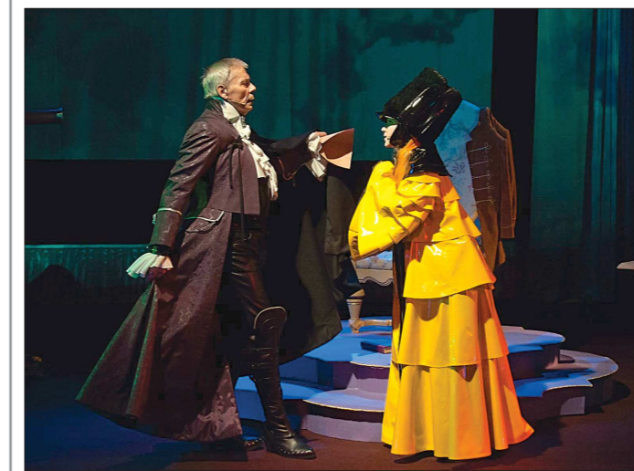
«Последняя ночь Казановы»

20,21 декабря. Последняя ночь Казановы, 18:00 24,25,26 декабря. Волшебная ночь, 11:00,15:00