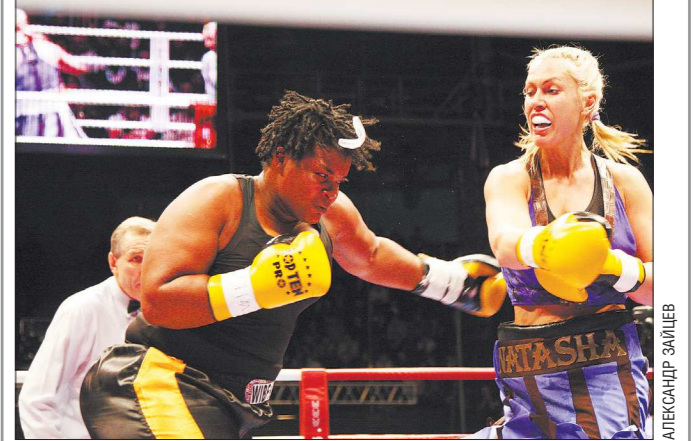
Наталья Рагозина (справа) – единственная женщина, которая сумела стать чемпионкой мира по боксу сразу в двух весовых категориях.