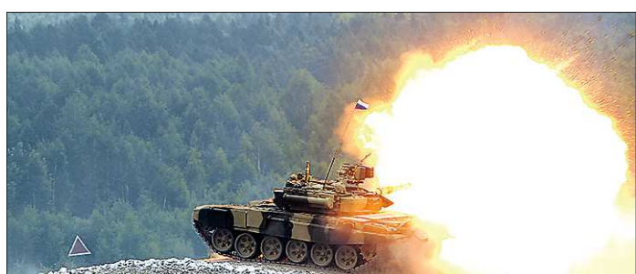
Главное достоинство выставки «Russia Arms EXPO» в том, что военную технику там показывают в действии