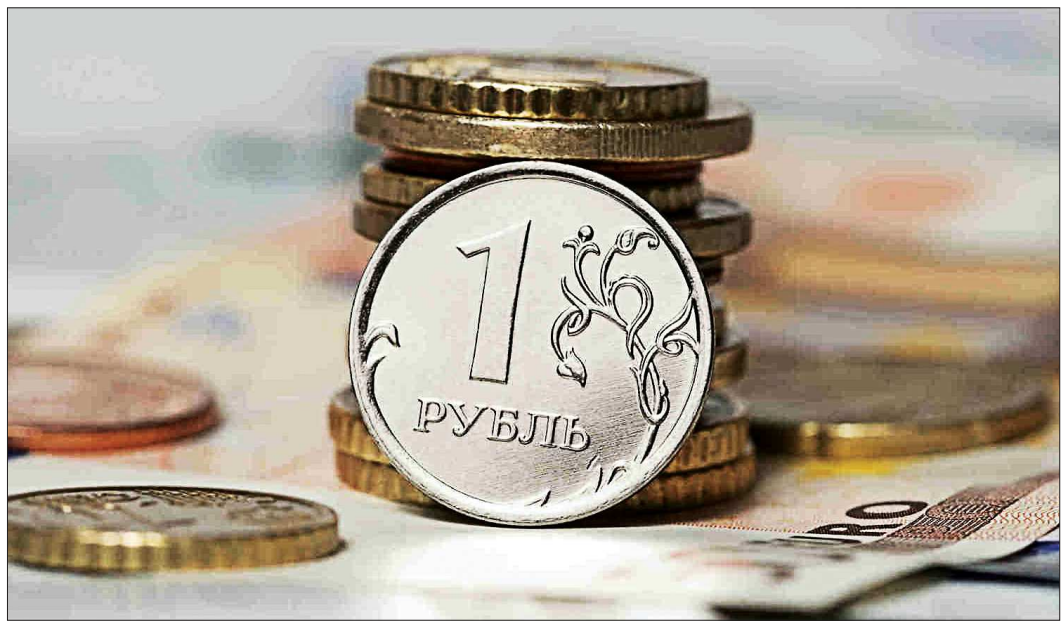
По мнению экспертов «ОГ», действия Банка России позволят укрепить национальную валюту

Решение Центробанка продиктовано прежде всего стремлением прекратить панику на валютном рынке.