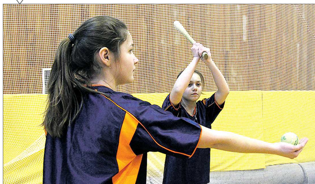
В минувшие выходные в Нижнем Тагиле прошло первое в нашей области масштабное соревнование по традиционной русской игре — лапте

«Наш ответ американскому бейсболу» >>> VIII