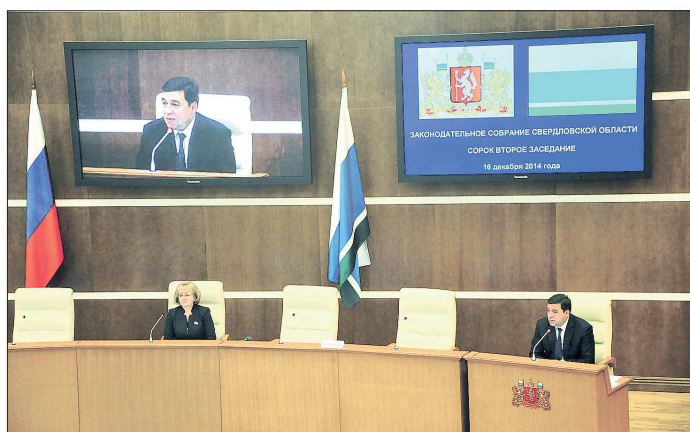
Евгений Куйвашев предложил областным депутатам активнее выступать экспертами в мониторинге эффективности действующих законов

Напомним, два года назад по этим показателям Сверд-