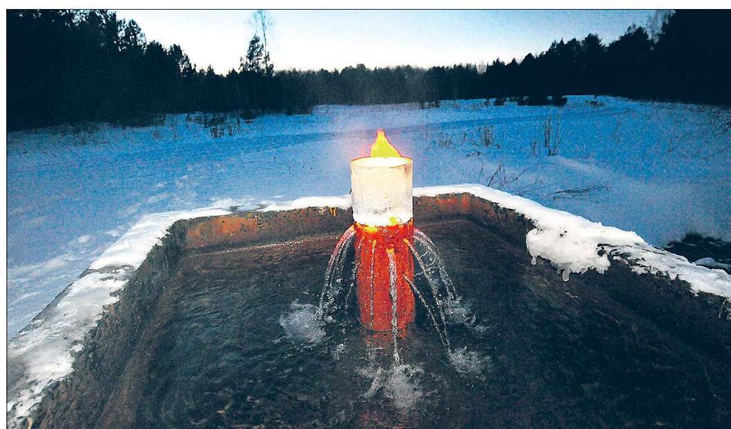
Вода не горит? В Махнёвском городском округе вам продемонстрируют абсолютно противоположное явление — горит, да ещё как, вот уже больше 50 лет. Правда, приспособить это чудо природы под нужды человека до сих пор никто не удосужился

«Наш ответ американскому бейсболу» >>> VIII