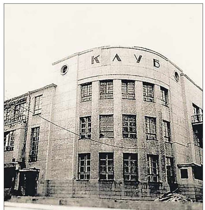
В этом здании на улице Володарского в 1986-1991 годах помещался Свердловский рок-клуб