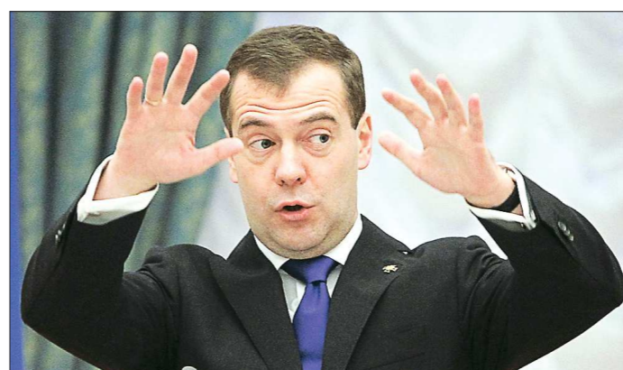
Дмитрий Медведев считает, что санкции – это вызов, на который мы должны ответить

Среди главных минусов девальвации премьер назвал снижение покупательной способности населения, но заверил, что правительство будет и впредь индексировать зара-