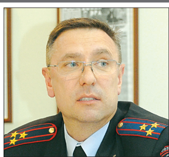
Олег КУРАЧ, начальник управления экономической безопасности и противодействия коррупции главного управления МВД России по Свердловской области