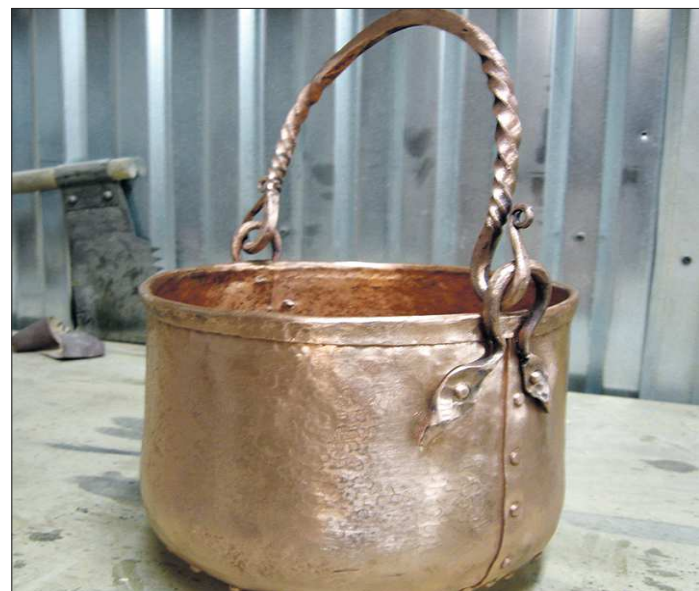
Этот медный котелок вместимостью пять литров верхнепышминские ремесленники сделали по заказу реконструктора из английского городка Портсмута

Через «Фэйсбук» на уральских мастеров начали выходить зарубежные заказчики. Совсем недавно один английский реконструктор из Портсмута заказал им медный котёл и кожаные косячные меха. Сейчас ребята ведут переговоры с эстонцем.