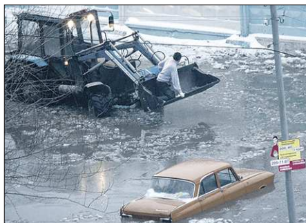
Движение по улице Крестинского перекрыли, а на месте аварии работали аварийные бригады