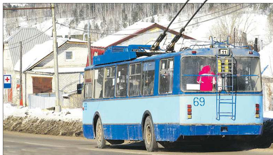
После ликвидации троллейбусной линии провода скорее всего сдадут в металлолом — сети настолько изношены, что никакое троллейбусное хозяйство не рискнёт их использовать

Автобусы комфортабельные, низкопольные, с дополнительным отоплением, летом — с кондиционированием. Что важно — это не б/у, а новые автобусы. Качество обслуживания будет на порядок выше, я уверен, что любой житель, прокатившись на новых автобусах, сразу оценит это. Стоимость нас устраивает, она