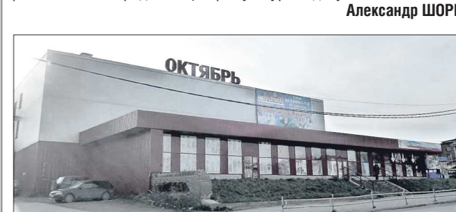
«Октябрь» прекратил функционировать как кинотеатр в 90-е годы прошлого века, сейчас в этом помещении торговый центр с тем же названием

КСТАТИ. Сегодня единственный кинотеатр в Краснофимске расположен в городском Центре культуры и досуга.