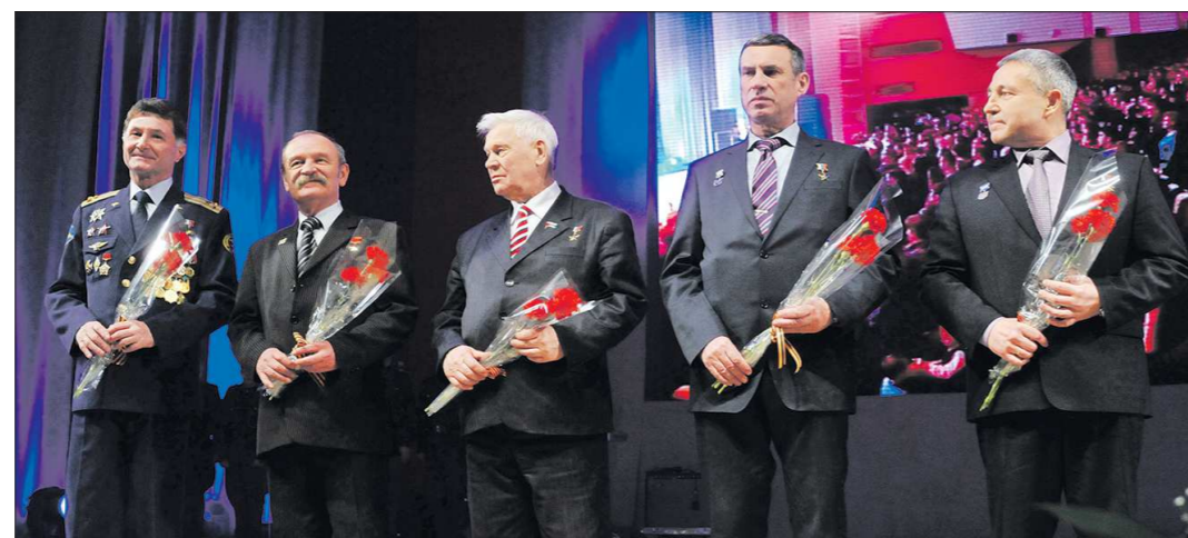
На «Вахту Героев» в Екатеринбурге заступили пять Героев Советского Союза и 22 Героя России из Свердловской области и других субъектов Российской Федерации

9 декабря (по старому стилю — 26 ноября) 1769 года, в день памяти святого Георгия (Юрьев день, как называли его тогда), императрица Екатерина II учредила высший военный орден. Вплоть до 1917 года эта дата отмечалась в нашей стране как День кавалеров ордена Святого Георгия. Предназначенный для награждения воинов, проявивших в боях доблесть, отвагу и мужество, орден Святого Георгия был восстановлен Указом Президента России в 2000 году. А спустя ещё семь лет была возрождена и традиция отмечать 9 декабря как памятную дату России, получившую