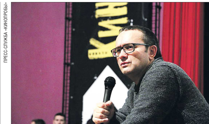
Встречи со знаменитыми режиссёрами в Доме кино заканчивались уже около полуночи — зрители не хотели отпускать мэтров. Билл Плимpton (на фото — слева) никому не отказал в автографах, и эту приятную процедуру пришлось проводить аж в три захода. Андрей Звягинцев (справа) терпеливо и с юмором отвечал, даже если трижды спрашивали об одном и том же

лучилось. После этого я ушёл из журналов. Мне тогда говорили: «Что ты делаешь, чем же ты будешь зарабатывать на жизнь? Анимацией уж точно себя не прокормить». Я же стоял на своём... И мне удалось доказать им обратное.