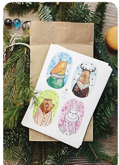
Новая коллекция открыток от Риты к Новому году