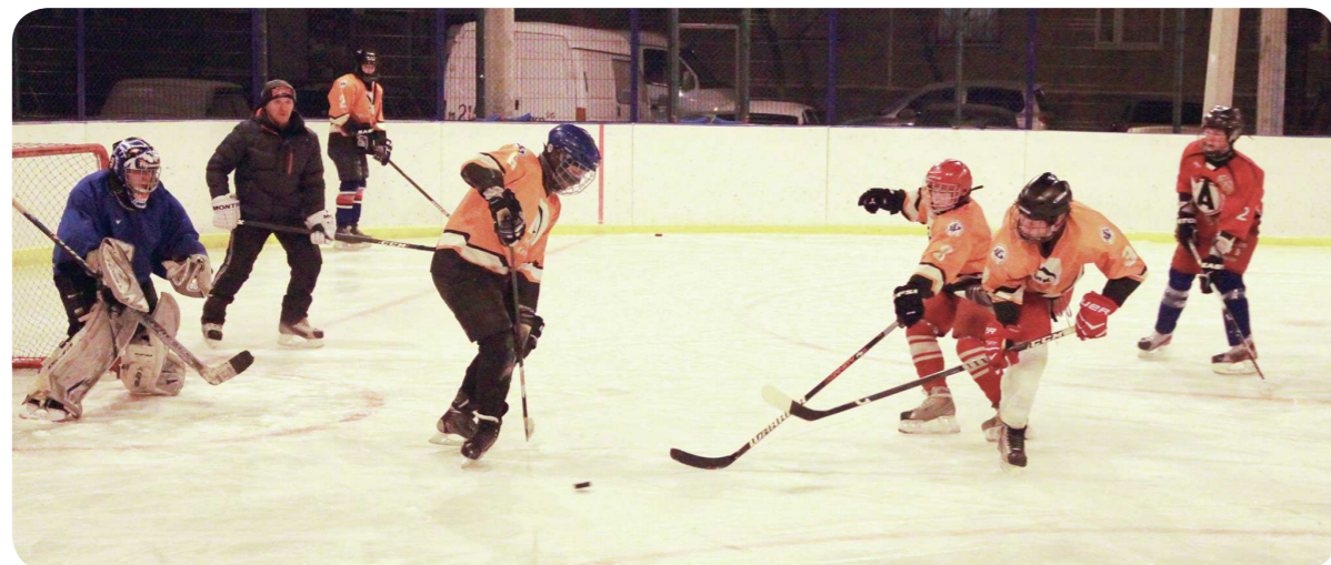
Во время тренировок хоккеисты дворового клуба «Фотон» играют в свитерах своих любимых команд. Форма с символикой своего клуба у них тоже имеется, но её берегут для соревнований, чтобы случайно не повредить