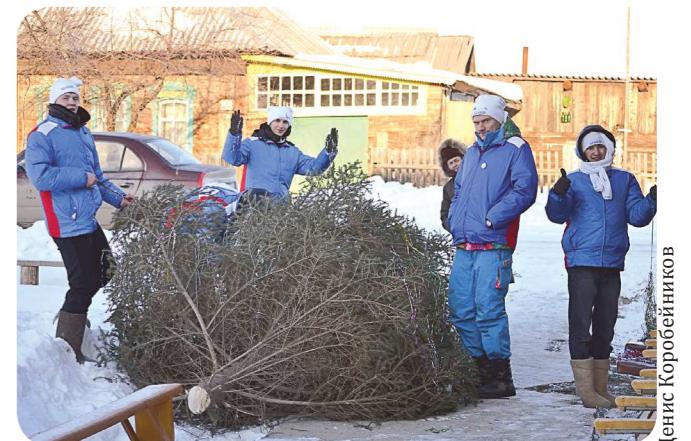
Студенты из отряда «молодёжного десанта» «Эдельвейс» установили новогодние ёлки в домах культуры в деревне Коптяки и Алапаевске

Полный фотоотчёт с тренировки дворового хоккейного клуба «Фотон» смотрите на сайте «Областной газеты»: www.oblgazeta.ru