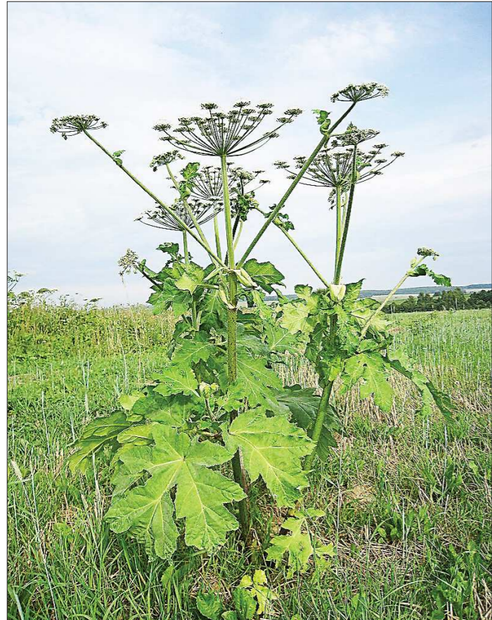
Борщевик Сосновского – очень крупное растение. Его рост составляет обычно около метра, но во многих местах могут встречаться экземпляры ростом до 3 метров. Назван в честь исследователя флоры Кавказа Дмитрия Сосновского (1885–1952)