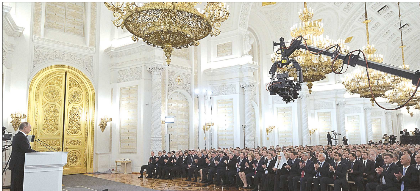
На оглашении послания президента в Георгиевском зале Кремля присутствовали члены Совета Федерации, депутаты Государственной Думы, члены правительства, руководители Конституционного и Верховного судов, губернаторский корпус, председатели Законодательных собраний субъектов Федерации, главы традиционных конфессий, общественные деятели, в том числе главы общественных палат регионов, руководители крупнейших средств массовой информации

С чего всё началось? Я вынужден напомнить сегодня об этом. Трудно даже поверить, с чего всё началось — казалось бы, с технического решения Президента Януковича перенести подписание договора об ассоциации Украины с Евросоюзом. При этом, подчеркну, речь шла даже не об отказе от этого документа, а только о переносе сроков с целью