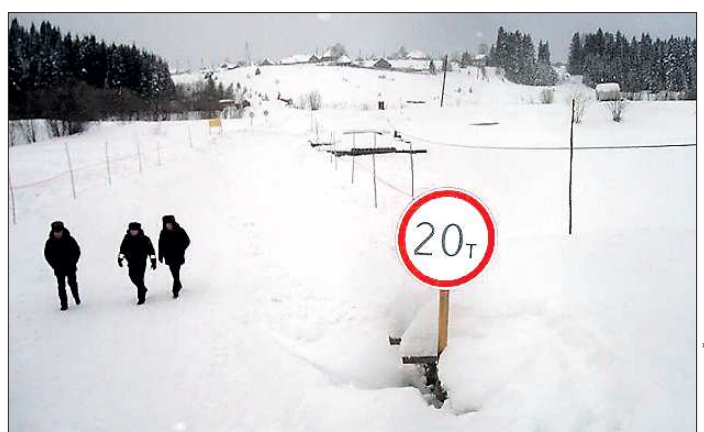
Сразу после открытия на переправу пускают машины весом до пяти тонн, позже, в зависимости от погодных условий, разрешённый вес увеличивается до 20 тонн

Многочисленные ограничения и непредсказуемость уральской погоды несколько уменьшают актуальность ледовых переправ, особенно в северных районах. Глава инспекции уверен, что они не изживут себя, потому что помогают экономить. Зимой за счёт переправ путь в отдалённые деревни Гаринского, Таборинского, Серовского районов сокращается в четыре-пять раз. Альтернативой ледовой переправе может стать капитальный мост — это обещало бы круглогодичное сообщение между населёнными пунктами, как, например, произошло в прошлом году в Гарях. Но капитальный мост — это огромные деньги, а ледовая переправа стоит в сравнении с ним во много раз дешевле.