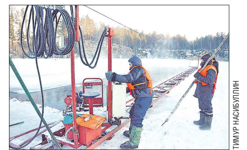
Раньше подобной техники не было, лёд пилили и вытаскивали руками. А сейчас процесс максимально автоматизировали