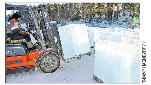
В таком виде лёд отправляют в Екатеринбург

ГОСУДАРСТВЕННОЕ БЮДЖЕТНОЕ УЧРЕЖДЕНИЕ СВЕРДЛОВСКОЙ ОБЛАСТИ «РЕДАКЦИЯ ГАЗЕТЫ "ОБЛАСТНАЯ ГАЗЕТА"». ОБЩЕСТВЕННО-ПОЛИТИЧЕСКОЕ ИЗДАНИЕ