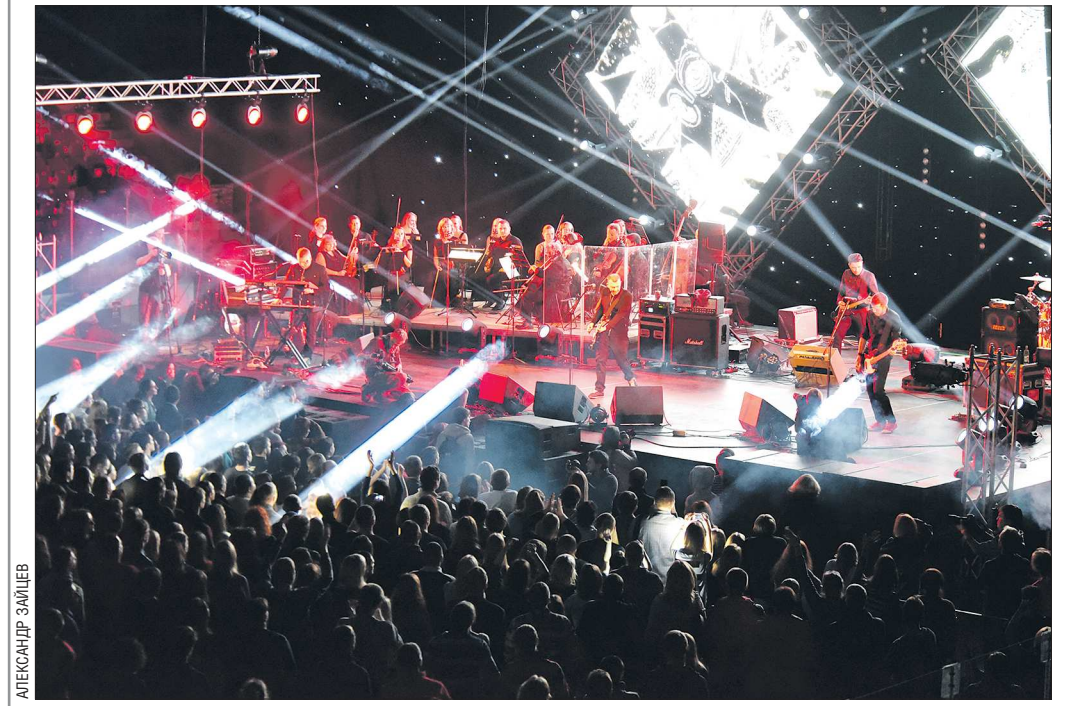
На днях в КРК «Уралец» прошёл юбилейный концерт «Смысловых Галлюцинаций». Хотя своё 25-летие группа отмечает с начала года, всё-таки главным юбилейным торжеством считается именно этот концерт. На разогреве у именинников играли другие уральские группы — «Сансара» и «Космик латте». Пока они пели, стало ясно, что в «Уральце» большие проблемы со звуком: во время некоторых композиций была слышна только музыка и изредка — отдельные слова солиста. К счастью, проблема оказалась не в акустике помещения, а в настройке оборудования, и к выходу Сергея Бобуца и «Смысловых Галлюцинаций» все неполадки успели устранить. Юбилейный концерт был особенным — на сцене вместе с «глюками» был Камерный оркестр «В-А-С-Н». Сам выход группы на сцену заставил толпу (на концерте было пять тысяч зрителей) вздрогнуть и замереть. Из полной темноты сначала зазвучала симфоническая музыка, а уже затем к ним присоединился основной состав музыкантов. Разумеется, любимые песни от этого только выиграли: исполнение стало более объёмным, глубоким. Сотрудничество показало настолько уместным, что многие фанаты уже мечтают о совместном альбоме группы и оркестра. После концерта музыканты написали в соцсетях: «Друзья! Это было так круто, что только сейчас мы обретаем дар речи. Главный концерт юбилейного года состоялся. Мы расцениваем это как переход на качественно новый уровень! Добро пожаловать на следующий уровень вместе с нами!»