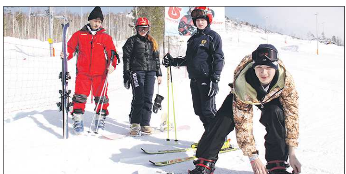
В Свердловской области 13 лыжных баз. Традиционно горнолыжный сезон длится с ноября по апрель

Евгений КОНДРАТЬЕВ Мы продолжаем публиковать обзоры мест массового спортивного отдыха в зимний период. Сегодня навести лыжи к горнолыжным базам. После успеха нашей сборной в Сочи всё больше людей встают на горные лыжи и сноуборды. Даже первые лица государства осваивают этот экстремальный вид спорта. Ситуация с горнолыжными базами вполне благоприятная, так что президент и премьер после сочинских трасс вполне могли бы протестировать и наши. А пока это делает «ОГ».