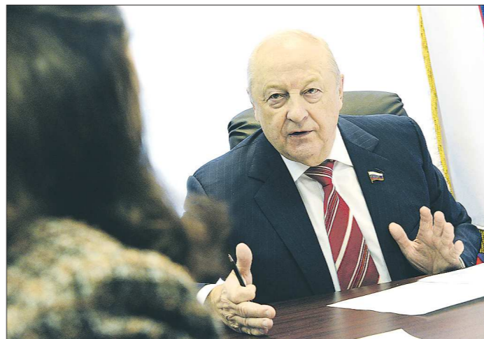
Эдуард Россель: «Не вижу смысла в сокращении школ на селе»

— Проблему можно и нужно решать. Можно, конечно, переводить школы в статус филиалов, сокращать ставки директоров и главбухов. Но в таком случае надо, чтобы в филиале один из учителей, экономически самый грамотный, выполнял функции бухгалтера, отвечал за расходование выделенной сметы. Не вижу смысла заниматься сокращением школ на селе. Оптимизировать надо с умом. Может, где-то целесообразно объединять школы, чтобы сокращать в них управленческий персонал, директоров и главбухов. Думаю, в крупном городе особых проблем с трудоустройством у них не будет. А на селе нужен другой подход. Сегодня в общественной приёмной обратился молодой сельский учитель, который раньше в городе жил, но со всей своей семьёй и с такими же, как он, энтузиастами, переехал в деревню. Да ведь их надо на всю Россию показывать как образец для подражания! Чтобы и другие выпускники педагогических вузов брали с них пример. А у нас кто-то затеял оптимизацию в той сельской школе, в которой они начали работать... Зачем? Думаю, что в муниципальном образовании, где предпринима-