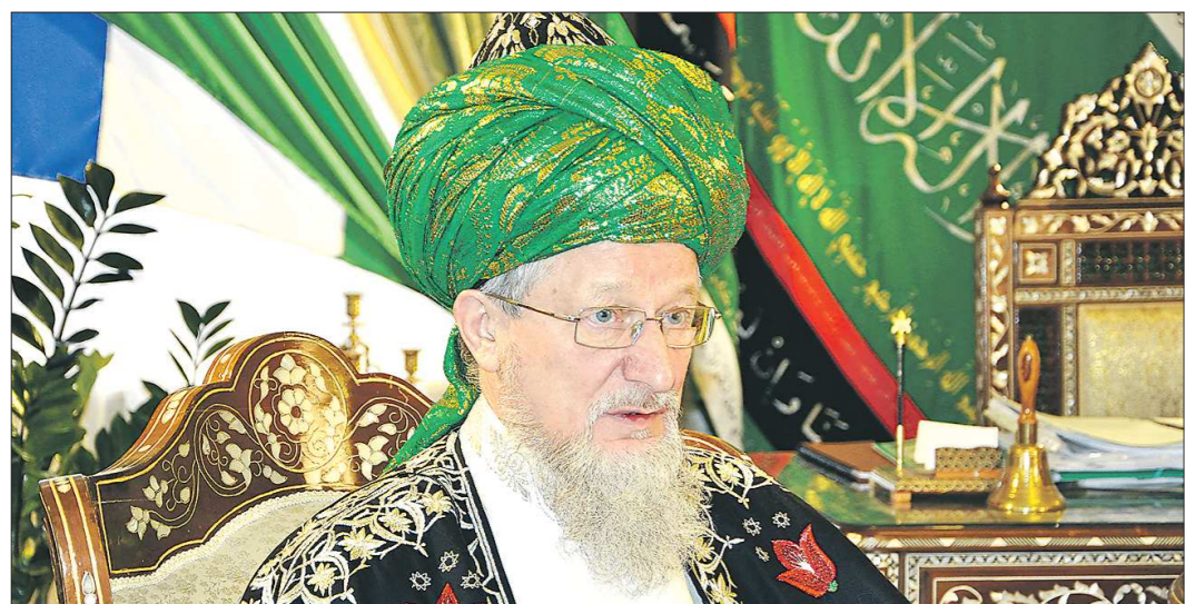
Верховный муфтий Талгат Сафа Таджуддин является официальным представителем мусульман РФ в ЮНЕСКО, Организации Исламской Конференции, Европейской лиге мусульман и других международных организациях