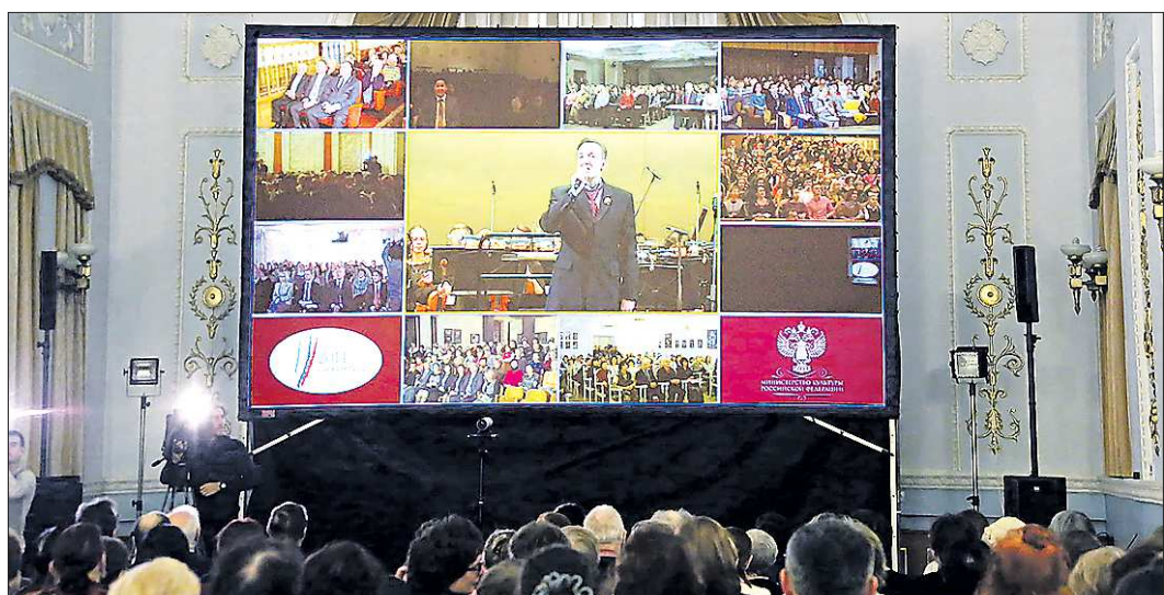
В ходе телемоста представители разных областей сошлись во мнении, что виртуальный зал стал настоящим подарком для любителей классической музыки всей страны

много времени на «стойке», и это отставание наша команда сократить не смогла. Сборная России финишировала только 12-й, отстав от французских, выигравших эстафету в упорнейшей борьбе, на 57,7 секунды. В тройке призёров также оказались Норвегия и Германия. Все три команды разделили 0,2 секунды. Эстафетная гонка подкинула пищу для размышлений тренеру нашей сборной. Впрочем, биатлонный сезон, которому отведена роль минимального в олимпийском цикле, ещё только начинается. Уже завтра мужчины выйдут на старт двадцатикилометровой индивидуальной гонки, и нам предстоит увидеть в деле и других представителей нашей команды, в частности, Антона Шипулина.