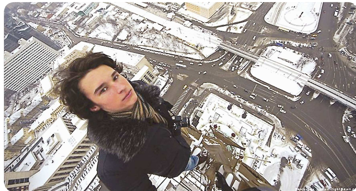
Известный российский экстремал Кирилл Орешкин ради впечатляющих селфи покоряет небоскрёбы. Какая польза от его деятельности – непонятно

Прокрастинация – это английское слово, которое, в свою очередь, образовалось из двух латинских: pro – «на» и crastinus – «завтра». Селфи (от англ. self – «сам», «себя»)