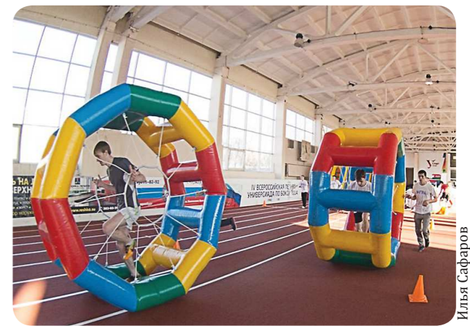
Студенты УрФУ померились силами и выносливостью на «Больших гонках». Соревнование в формате популярного спортивно-развлекательного шоу на федеральном канале прошло в университетском манеже. Правда, в отличие от телевизионной версии, уральским студентам не пришлось участвовать в конкурсах с разъяренными быками. В остальном же всё было очень похоже: участники преодолевали полосы препятствий из надувных конструкций, бежали в неудобных костюмах и так далее. «Большие гонки» проводились в рамках студенческого проекта «Изер», суть которого в том, что команда, один раз зарегистрировавшись, в течение всего года участвует в различных соревнованиях, не меняя свой состав.

У «Новой эры» есть своя группа на сайте «ВКонтакте»