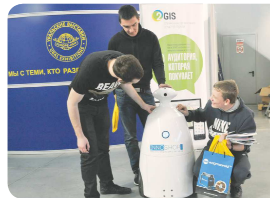
На создание робота Семёна робототехников вдохновила мультфильм «Валл-И»