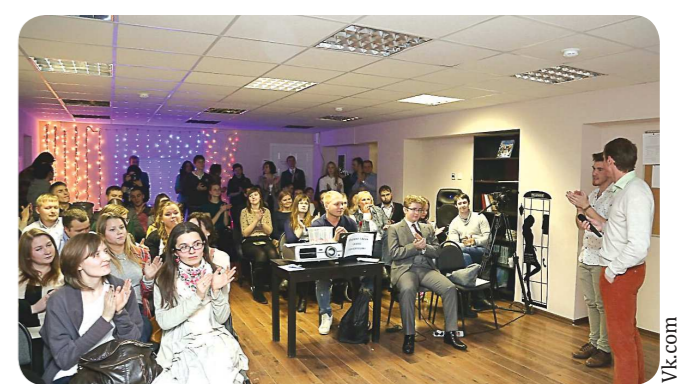
Выступить на «Ночной Пече Куче» в Екатеринбурге может любой желающий. Для этого нужно заранее узнать тему встречи в официальной группе в «ВКонтакте»: https://vk.com/pknekb , подготовить речь, презентацию из 20 слайдов и отправить заявку организаторам мероприятия.