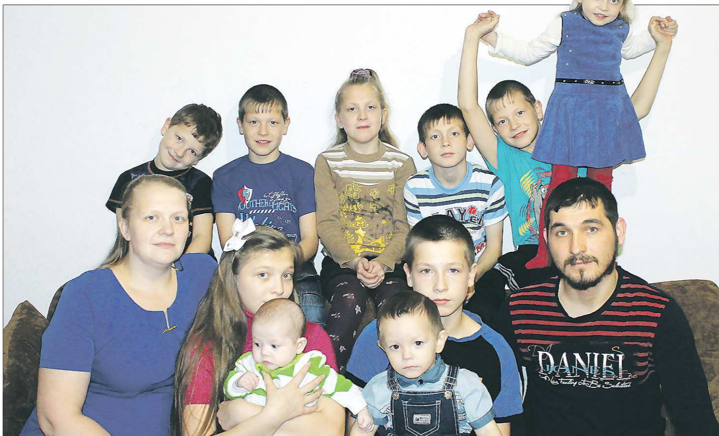
Другие материалы, посвящённые Дню матери – на стр. V и VII