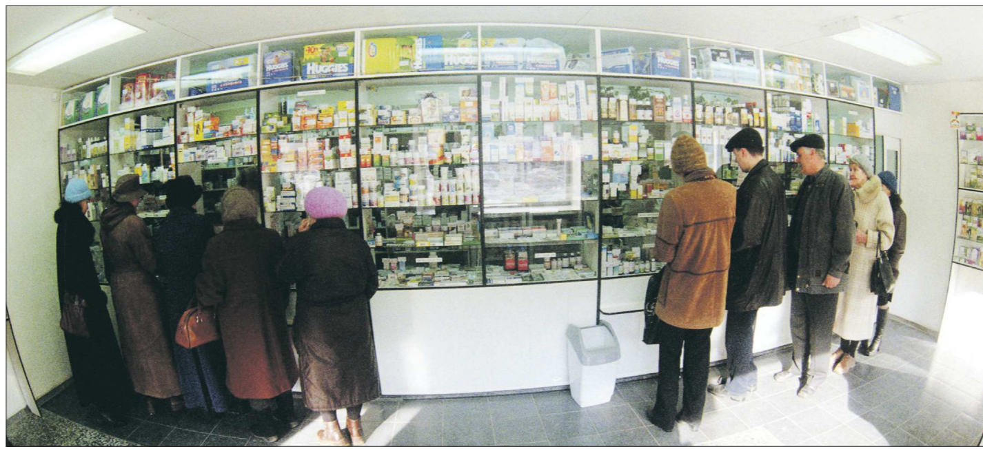
По информации Минздрава РФ, Россия уже производит более 60 процентов лекарств, необходимых стране

— Поздней осенью всегда возникает сезонный подъём респираторных заболеваний. Замечу: число заболевших напрямую зависит от того, сколько людей на территории привились от гриппа. Привились больше 40 процентов детей в садике — значит, эпидемии не будет, привили меньше — придётся готовиться закрывать детские коллективы на карантин. Да, человек, поставивший прививку, тоже может заболеть, но в этом случае у него не будет тяжёлых осложнений в виде пневмонии, менингита, отитов... Да и болезнь будет проходить намного легче. Пока в области нет эпидемии, можно ещё успеть поставить прививку от гриппа.