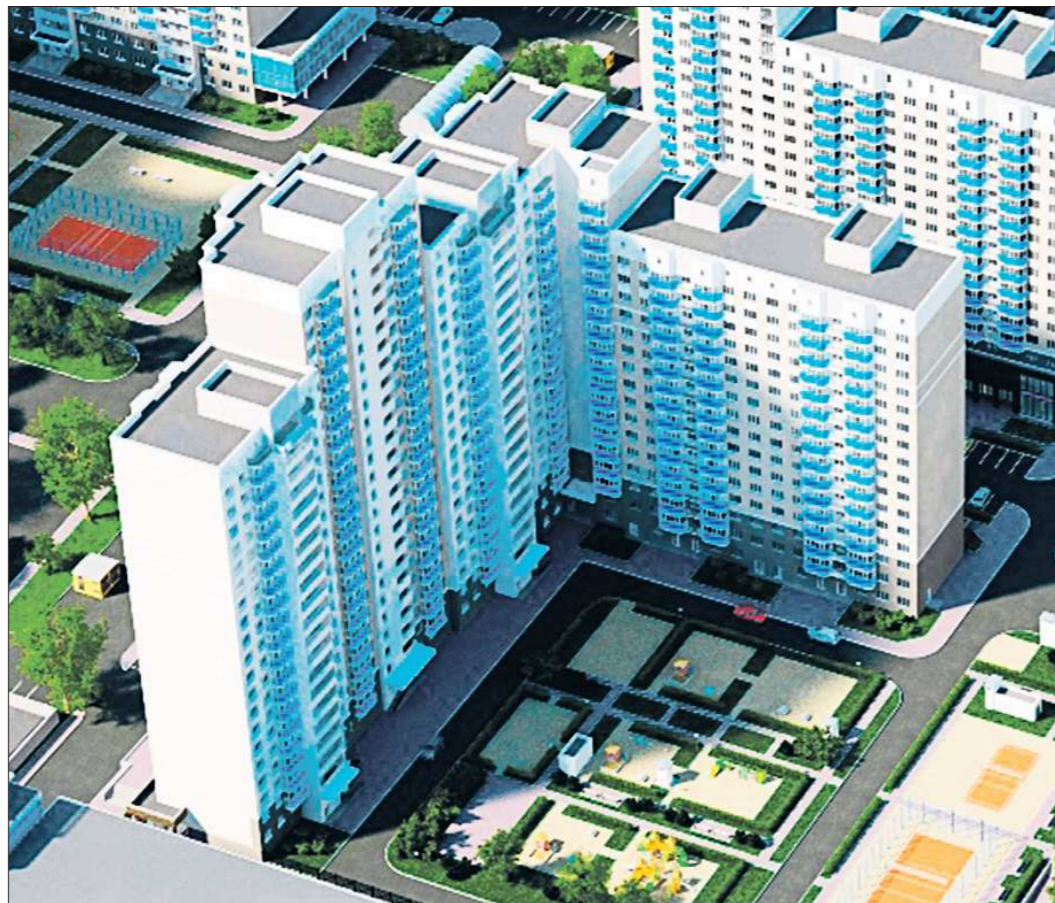
Несомненный плюс Университетского — удобные, хорошо оборудованные дворы

— Существуют строгие параметры, которым должен