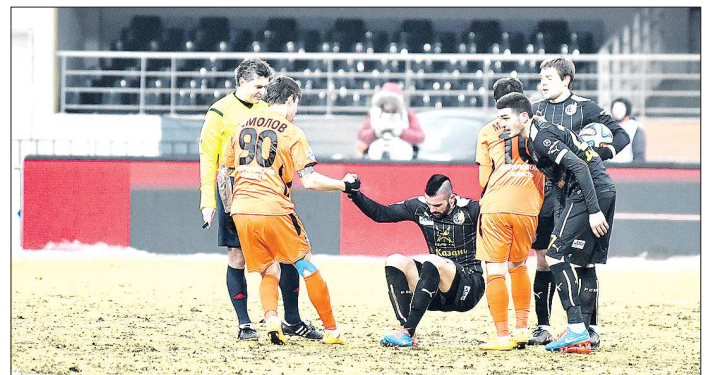
Подняться с поля, конечно, помогут. Но вот вырваться из подвала турнирной таблицы футболистам «Урала» никто помочь не будет

На данный момент турнирная таблица чемпионата разделилась на две равные части: разве что саранская «Мордовия» и отчасти «Уфа» исполняют роль заветной для многих золотой середины — они обеспечили себе более или менее комфорт-