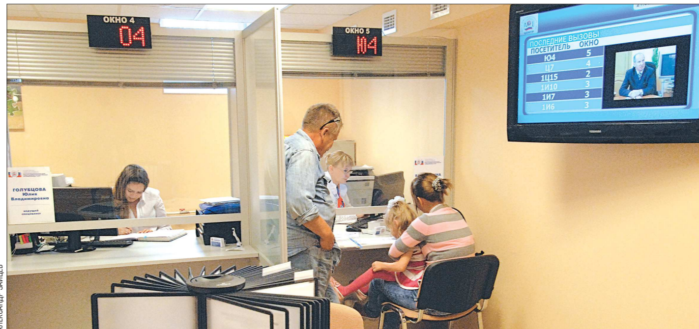
Чтобы пользоваться госуслугами онлайн, необходимо подтвердить регистрацию, например, в МФЦ

До конца года планируют создать ещё 61 пункт под-