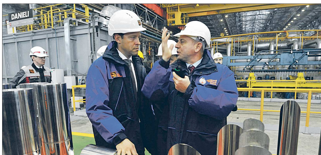
Министр промышленности и торговли РФ Денис Мантуров (слева) и председатель совета директоров Трубной металлургической компании Дмитрий Пумпянский в день пуска трубопрокатного комплекса с непрерывным станом FOM на Северном трубном заводе. Этот стан по праву называют одним из самых крупных инвестпроектов 2014 года