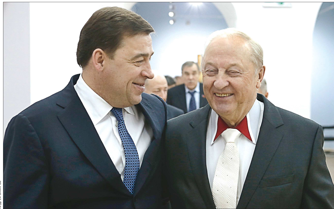
Во время инаугурации Евгения Куйвашева в мае 2012 года Эдуард Россель отметил, что новый губернатор «отлично справится с должностью. Главное – не рассчитывать на помощь Москвы, зарабатывать самим и жить по средствам»

На Среднем Урале принята новая инвестиционная стратегия региона до 2030 года. Она создана на базе программ, которые были разработаны по инициативе прежнего губернатора Эдуарда Росселя. Евгений Куйвашев неоднократно отмечал, что для развития любого региона важно сохранить преемственность традиций и власти, возможность перенимать опыт предшественников