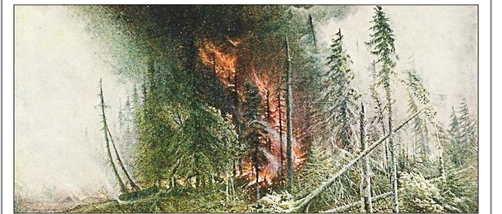
Одна из самых известных картин Алексея Денисова-Уральского «Лесной пожар»