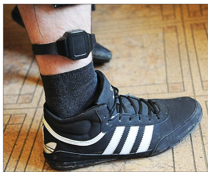
Сотрудникам уголовно-исполнительной системы теперь обязательно ходить за подопечными по пятам. Электронный сторож на лодыжке надёжен и неподкупен