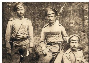
Пётр Щетинкин (в центре) во время Первой мировой войны. На груди у него полный набор Георгиевских крестов

В марте 1972 года на экраны кинотеатров страны вышел фильм Свердловской киностудии «Кочующий фронт». Главным героем этой картины партизан Пётр Щетинкин (его играл актёр Пётр Глебов) — знаменитый герой Гражданской войны. Другой факт его биографии гораздо менее известен: в годы Первой мировой Щетинкин был одним из самых именитых Георгиевских кавалеров русской армии.