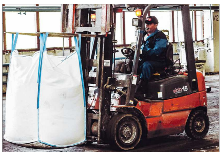
Первыми краснотурьинский порошок смогут оценить жители Челябинска и Тюльяти. Туда готовятся к отправке две фуры грузоподъёмностью до 20 тонн каждая

Химкомбинат называют первым резидентом индустриального парка «Богословский» — пока он не достроен, но уже стал конкурентом для аналогичных площадок в Новосибирске. Чтобы не ждать открытия парка, руководство химкомбината арендовало у