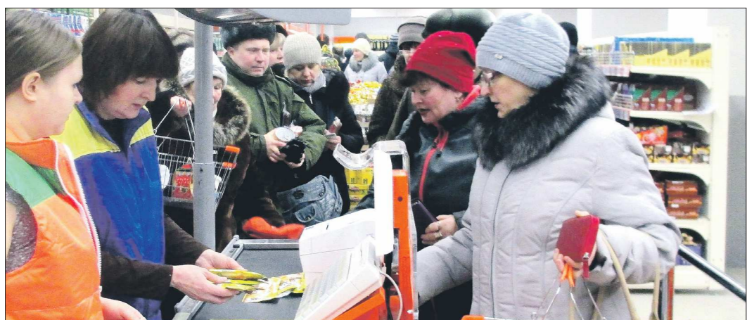
Специалисты Роспотребнадзора советуют потребителям всегда сохранять чек при покупке. В крайнем случае это поможет вернуть некачественный товар и обратиться с жалобой в надзорные органы

Время от времени этим фондом пользуются люди, оставшиеся без жилья. К примеру, погорельцы из посёлка Старатель были рады такой заботе города. А вот недавно пострадавших от пожара жильцов элитного дома на улице Учительской предложение мэрии переехать на время в общежитие оскорбило не на шутку. Мол, что вы нас в клоповник посылаете! Не вдохновила идея жить в помещениях маневренного фонда и вынужденных переселенцев с Украины. Те, кто остались в Нижнем Тагиле на постоянное жительство, предпочли снимать жильё у частных.