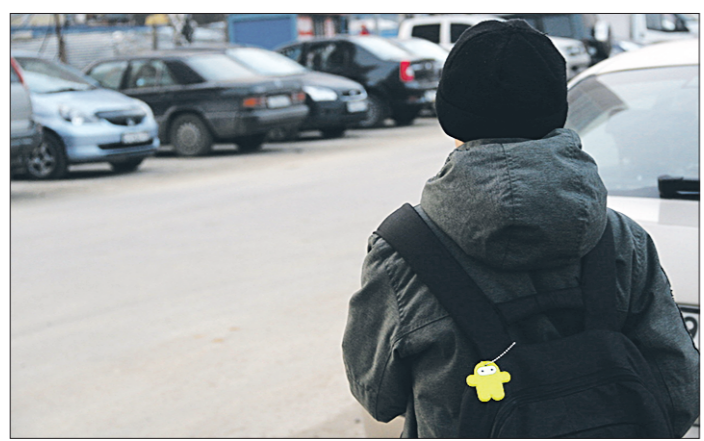
Светоотражающие наклейки можно приобрести в отделах школьных принадлежностей от 20 до 40 рублей за штуку

Что же делать деревенским жителям, которым нужно по темноте добираться, например, вдоль трассы до работы, а возможности купить светоотражатель нет? В такой ситуации можно посоветовать использовать подручные средства: велосипедные катафоты или любой отражающий свет материал — фольгу или зеркало. Пока нет утверждённых стандартов, это не будет считаться нарушением. Но лучше, конечно, купить наклейку или брелок. Возможно, он спасёт вам жизнь.