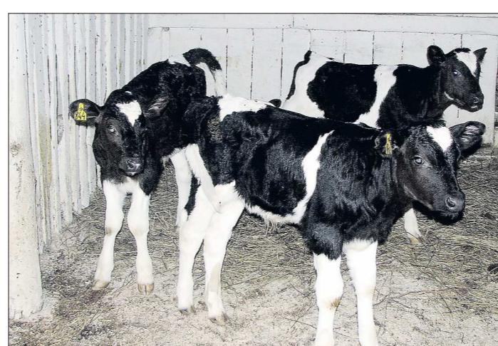
Сейчас на ферме в «Бортыево» два десятка телят, они дают хорошие привесы — 800 граммов ежедневно

тересов свердловских сельхозпроизводителей. Как это ему удаётся? В помощь на ферму он постоянно нанимает по три-четыре человека, а на сезонные работы привлекает десятки соседей из окрестных сёл. К сожалению, среди них нет жителей Решы. — В деревне остались люди пенсионного возраста, всего 40 человек — рассказывает местный староста Сергей Соседков, — так что рабочие места им не нужны. Но с фермерами селеня связывают добрые отношения. Они не отказывают деревенским жителям в помощи — выделяют трактор для расчистки улиц, технику для проведения земельных работ, перевозки грузов. Вместе фермер и старо-