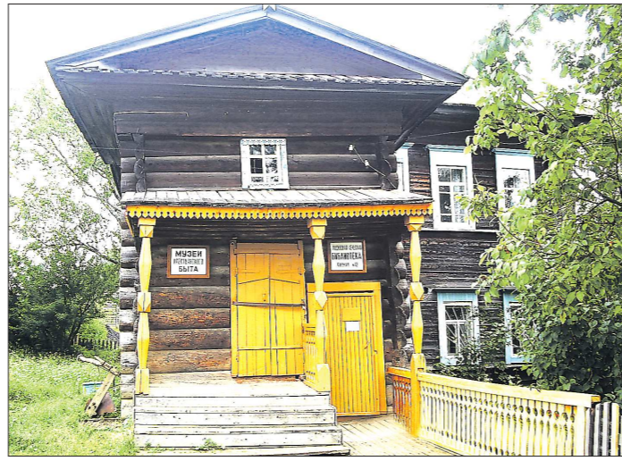
Музей истории и старообрядческой культуры расположен в деревянном здании XIX века. Ценных экспонатов здесь не так много, зато сотрудники очень находчивые