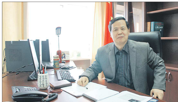
Г-н Тянь Юнсян был назначен Генеральным консулом КНР в Екатеринбурге в январе 2014 года. До этого он работал начальником департамента в Международном отделе Центрального комитета Компартии Китая

С учётом новой экономической обстановки в Азиатско-Тихоокеанском регионе (АТР) главы стран – участников саммита обсудили три важные темы: улучшение региональной экономической интеграции; развитие инноваций, рост и развитие экономики; укрепление всесторонних связей и развитие инфраструктуры. На саммите достигнуты договорённости в широкой сфере. Было решено начать и продвигать процесс создания зоны свободной торговли АТР.