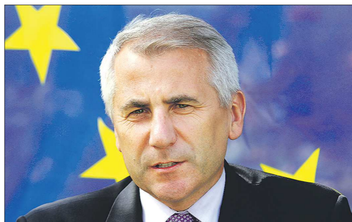
Вигаудас Ушацкас служил в Советской армии, свободно владеет английским и русским языками и прекрасно говорит по-французски. Он возглавляет представительство Евросоюза в России с сентября 2013 года

— Европейцы и россияне очень по-разному оценивают