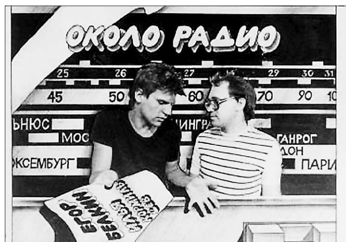
Так в итоге выглядела обложка альбома «Около радио» для неё взяли снимок из архива Свердловского рок-клуба, сделанный студией «Тутти Рекордс». Фотографии, которые сделал Ракович, так на обложку и не попали. Зато попали на страницы «Областной газеты»