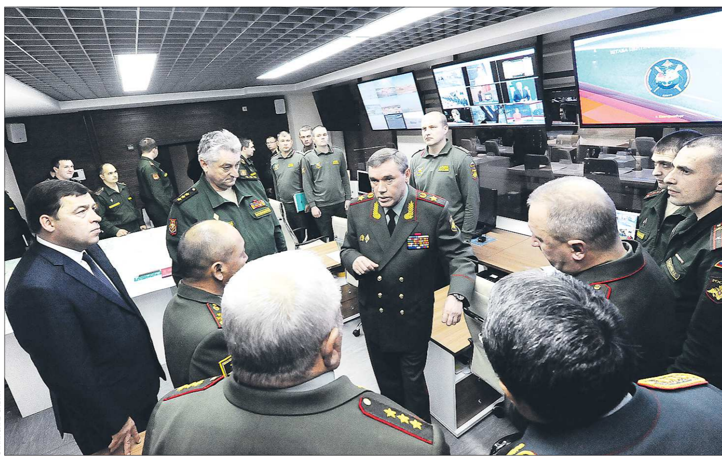
Малый зал регионального центра управления штаба ЦВО. Первый замминистра обороны — начальник Генерального штаба Вооружённых сил РФ Валерий Герасимов (в центре) рассказывает своим коллегам из государств-членов ОДКБ и губернатору Свердловской области Евгению Куйвашеву (слева) о новых принципах и способах управления войсками

Вчера Екатеринбург впервые принял у себя представителей военного комитета Организации Договора о коллективной безопасности (ОДКБ). Начальники генеральных штабов армий шести государств, обсудив совместные учения, отметили возросший уровень подготовки войск и взаимодействия коллективных сил. Одним из ключевых моментов встречи стало обсуждение единой для стран-участниц системы противовоздушной и противоракетной обороны