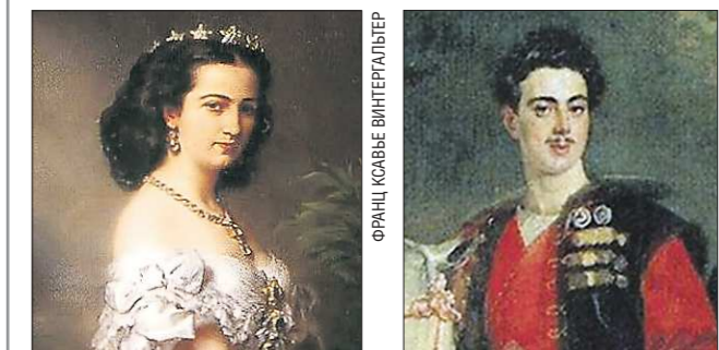
Матильда Бонапарт пережила Анатолия Демидова на 34 года