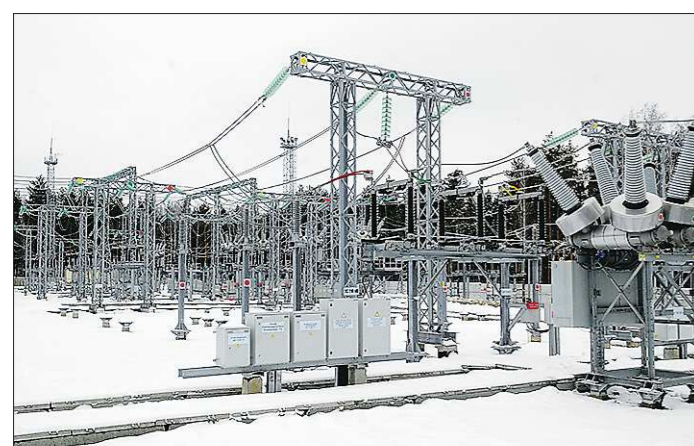
На реализацию проекта ушло 232 миллиона рублей