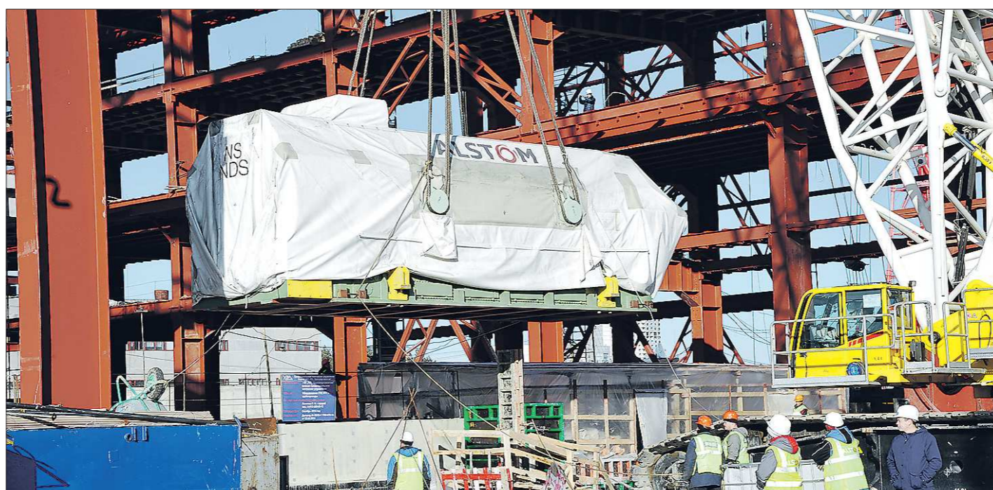
Через пару минут груз весом в 250 тонн будет установлен точно на специальный фундамент