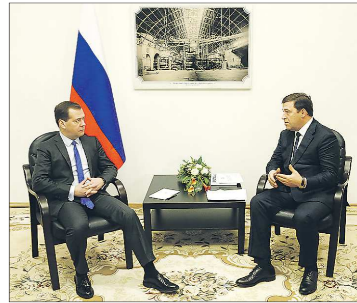
Встреча прошла в рамках визита премьер-министра в Полевской на Северский трубный завод

«Президент продемонстрировал уверенную позицию нашей страны в вопросах внешней политики, готовность решать вопросы путём диалога в рамках правового поля».