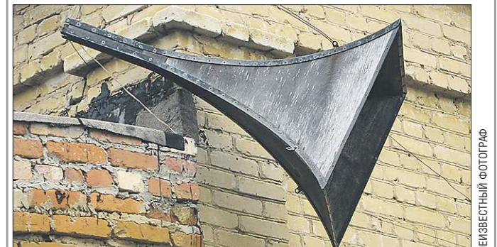
Вот так выглядели первые уличные репродукторы