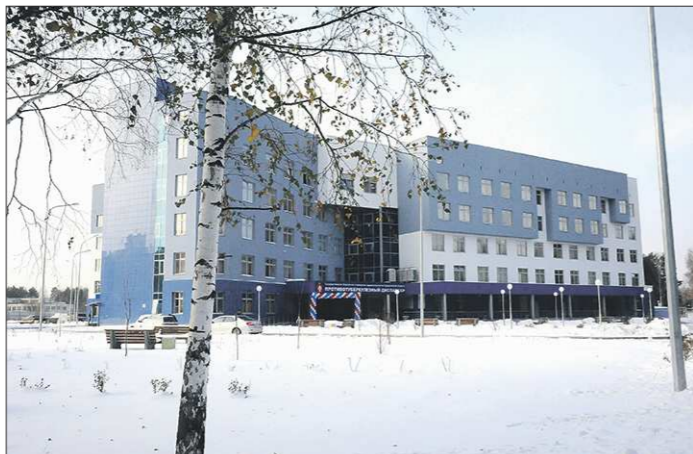
Сегодня обновлённый противотуберкулёзный диспансер уже принимает пациентов в штатном режиме

Вчера в Екатеринбурге открылся новый противотуберкулёзный диспансер. Оборудование, установленное в первой очереди комплекса зданий, позволяет диагностировать болезнь даже на самых ранних стадиях, в три с лишним раза быстрее и максимально эффективно лечить самые сложные случаи.