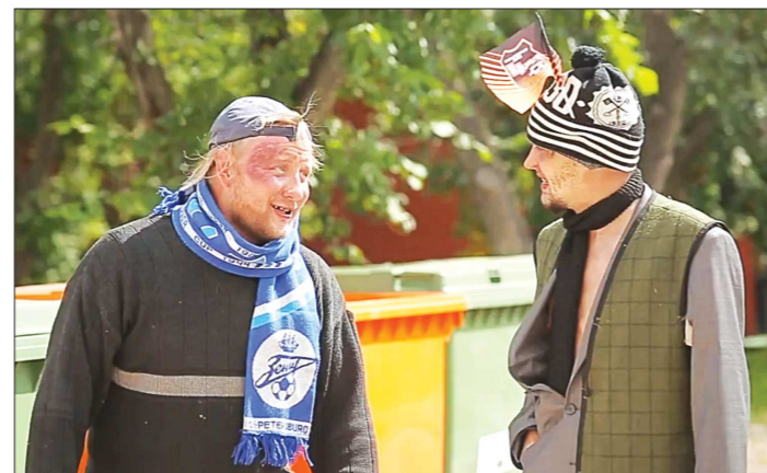
Промо-ролик перед матчем с «Зенитом» (кадр из него – слева) за два месяца набрал свыше 150 тысяч просмотров, став безоговорочным лидером на официальном канале клуба. Прематчевое видео со «Спартак» за неделю набрало почти 50 тысяч просмотров. Что ж, такой PR действительно работает. Вот только гордости за родной клуб не добавляет...

Перед каждым домашним матчем официальный канал «шмелей» публикует промо-ролик. Как правило, видео содержит юмористическую миниатюру, посвящённую будущей встрече. К сожалению, далеко не всегда в основу миниатюры положен безобидный для противника сюжет. За текущий сезон PR-отдел «шмелей» успел «отличиться» дважды. Перед матчами с «Зенитом» и «Спартак» были выпущены ролики с весьма циничным