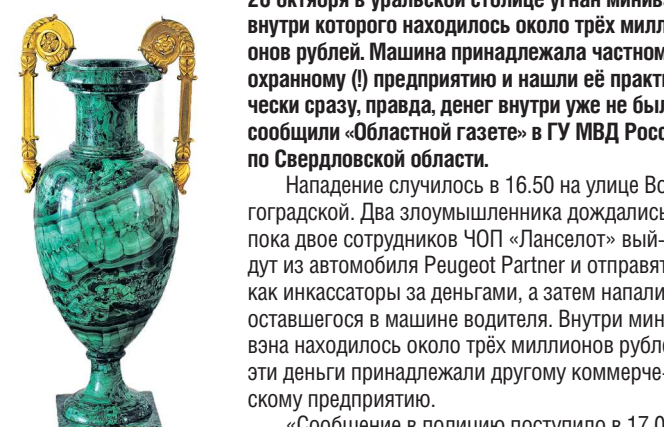
Все крупные поделки из уральского малахита — наборные, они состоят из небольших пластинок толщиной не более 1-2 миллиметров. Искусство мастера состояло в том, чтобы при наборе сохранить оригинальный рисунок знаменитых малахитовых узоров

Если сейчас вам предлагают купить малахит, то этот камень точно будет заирским, — говорит Григорьев. — Ну а если предлагают малахитовую облицовку, то скорее всего это будет китайский синтетический аналог, которому придали внешний вид малахита. Есть ещё малая вероятность продажи искусственного камня, но это и вовсе редкость: вырастить искусственный малахит несделано, а качество его явно хуже натурального.