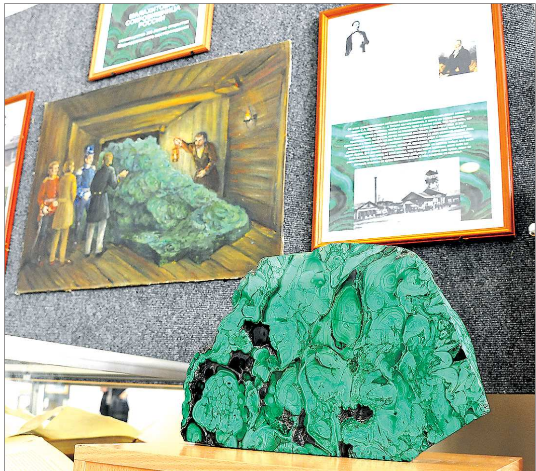
Самая большая глыба малахита была найдена на Медноурядском месторождении в июне 1835 года, её вес — около 40 тонн. В 1837 году эту глыбу демонстрировали на Урале цесаревичу Александру II (см. картину слева от экспоната). Позже глыбу раскололи, а камень использовали в облицовке интерьеров Исаакиевского собора и Эрмитажа в Санкт-Петербурге, сохранив лишь сравнительно небольшие куски (до 500 килограммов), которые сейчас находятся в музеях Екатеринбурга и Нижнего Тагила. Ну а самая большая глыба из ныне сохранившихся добыта в Гумёшевском руднике в 1770 году: её вес — 2,7 тонны, она хранится в Горном музее Санкт-Петербурга

Самые известные месторождения, где добывался малахит на Урале, — это Гумёшевский рудник (Полевской) и Медноурядское месторождение (под Нижним Тагилом). Но основное сырьё этих месторождений — медь, а малахит долгое время был лишь сопутствующим. Но купец Алексей Турчанинов ещё в 30-е годы XVIII века стал разрабатывать рудник комплексно, помимо меди активно пропагандировать изделия из зелёного камня. Привозил на рудник учёных, коллегников, полевские мастера творили из него всё больше поделок, изделия щедро дарили музеям. А потом малахит даже стал царским подарком — малахитовую вазу, канделябры, инкрусти-