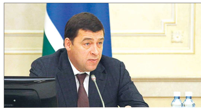
Евгений Куйвашев считает, что мобилизация доходов областного бюджета становится задачей номер один

По информации вице-преьера – министра финансов Галины Кулаченко, на 1 октября поступления в консолидированный бюджет области составили 137 миллиардов рублей. По сравнению с аналогичным периодом прошлого года – рост на 1,7 процента, или 2,35 миллиарда рублей. В то же время наблюдается от-