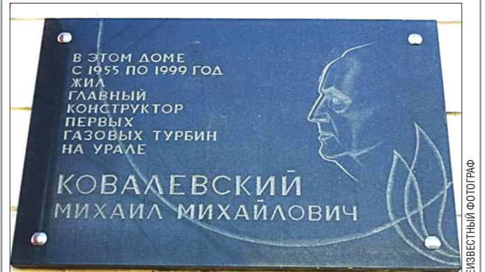
Автор этой мемориальной доски – екатеринбургский скульптор Валентина Соколова