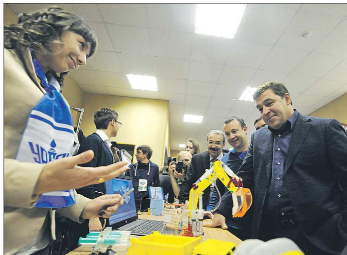
Студенты Уральского государственного педагогического университета разработали комплект развивающих технических игр для школьников

Молодёжный образовательный форум «Евразия-2014» начал вчера работу в Первоуральске на базе физкультурно-оздоровительного комплекса «Гагаринский». На открытии побывал губернатор области Евгений Куйвашев.