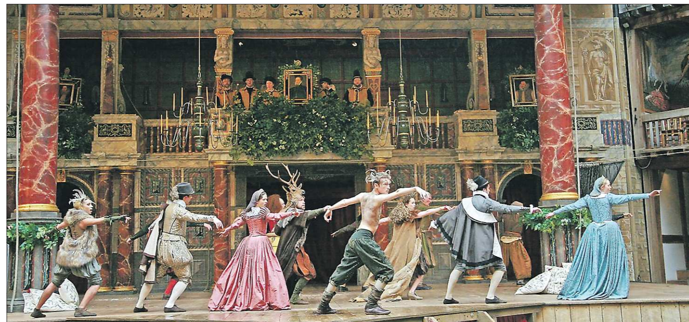
Так выглядит «Сон в летнюю ночь» на сцене театра «Глобус» в Лондоне. В Екатеринбурге организаторы обещают воссоздать оригинальную атмосферу