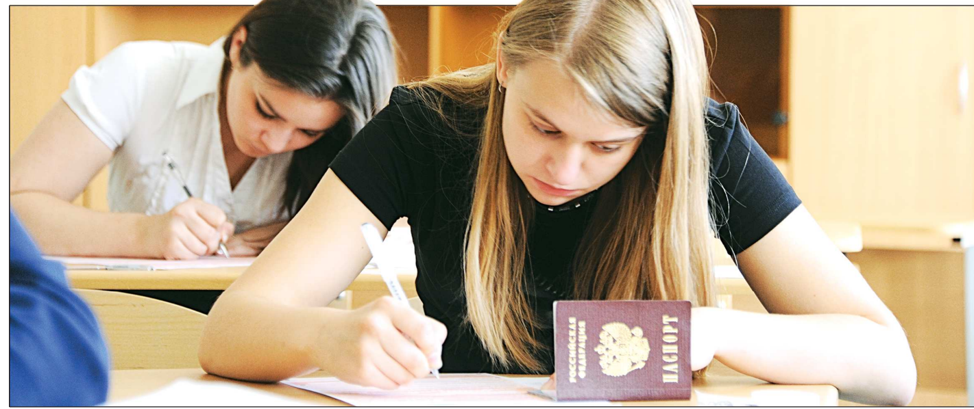
Сочинение школьники будут писать в декабре как допуск к традиционному ЕГЭ. Не удовлетворённые полученным результатом, смогут пересдать в дополнительные сроки

— Чаще всего — в неосведомлённости. Чтобы помочь, государство меняет законы. С января 2013 года начали действовать поправки в жилищном законодательстве: теперь сиротам предоставляют жильё по договорам специализированного найма. Первые пять лет обладатель такого жилья не может его ни продать, ни сдать в аренду. Однако этого оказалось недостаточно, чтобы отвести от наших подопечных любителей пожить. Более четырёхсот человек получают или ждут получения жилья по решениям судов ещё по прежним правилам. Однако нет ни одного сигнала, что мошенники пытаются отнять у сироты квартиру. Если же по уважительной причине он в своё время жильё не получил, то суды, как правило, решают дело в его пользу. У нас были случаи судебных разбирательств, в которых участвовали пятидесятилетние сироты.