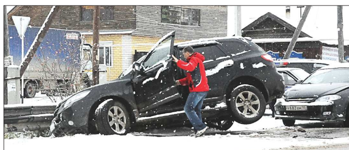
Первый гололёд запомнится надолго

Вчерашнее утро изменило привычные представления о пространстве и времени. Во всяком случае, у тех, кто встретил это утро на колесах. И уж точно у тех, кто не успел до гололёда поменять резину.