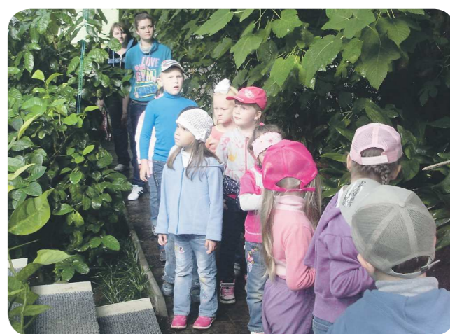
Изучать биологию школьники будут не только по учебникам, но и на практике: в лесу, парках и ботанических садах