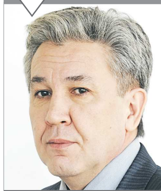
Нафик ФАМИЕВ, депутат Законодательного собрания Свердловской области