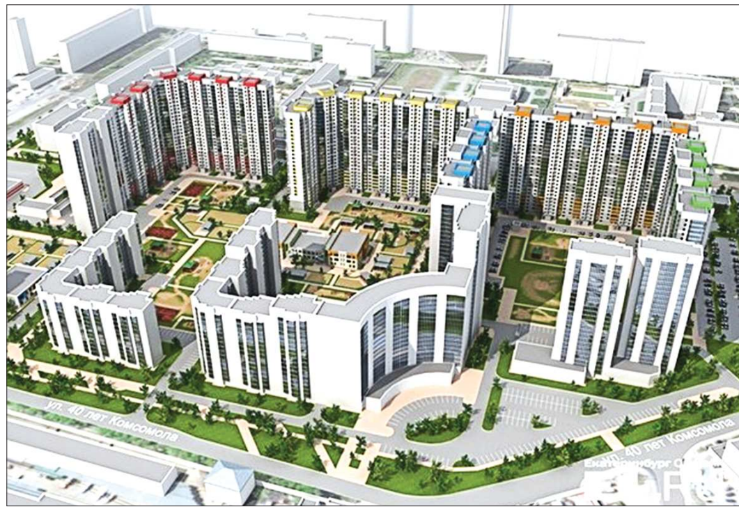
Такой через пять лет станет окраина микрорайона ЖБИ в Екатеринбурге

– Дома такой серии, являющиеся примерами современного панельного домостроения, в течение нескольких лет возводятся в Санкт-Петербурге, – рассказала представитель компании-застройщика «ЛСР. Недвижи-