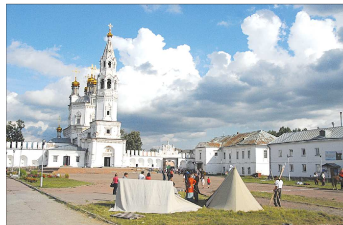
Верхотурские монастыри и кремль – жемчужины в туристическом ожерелье Урала

По словам министра строительства и развития инфра-