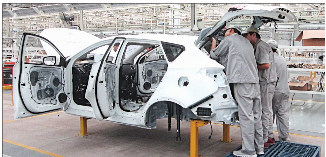
30 лет назад Китай производил 300 тысяч автомобилей в год. Сегодня – 22 миллиона! Машины, которые сходят с конвейеров заводов корпорации «Хавтай Мотор», экспортируются даже в... Африку