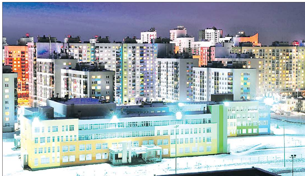
Школа №16 стала ещё одним украшением нового района Екатеринбурга

За образование почти двух тысяч детей в школе №16 отвечают 122 педагога. Настроение здесь задаётся с самого входа — учеников встречает корабль с аллыми парусами, лестницы в здании отделаны фресками, школьные концерты проходят в просторном зале на 500 человек. Особого внимания заслуживает сто-