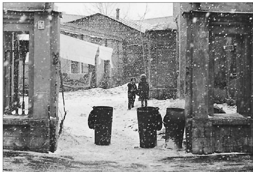
«Арбатские дети», 1960-е годы

— Есть ли на сочинском автодроме особенности? — Уникальность трассы является её расположение в Олимпийском парке, где всё пропитано духом соперничества. К тому же сочинский автодром входит в тройку самых больших по протяжённости автодромов мира.