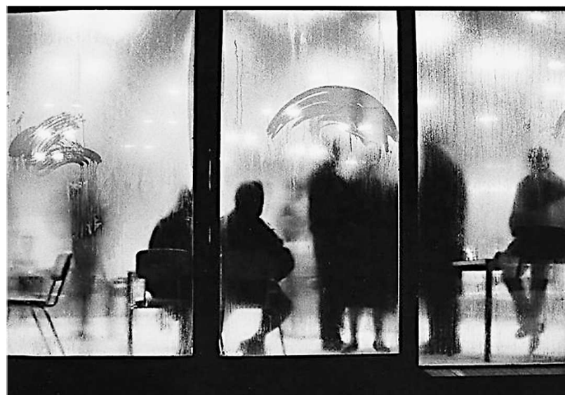
«Ночное кафе», 1962 год