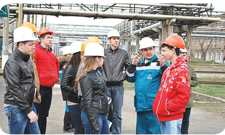
Развивать у школьников техническое мышление собираются с самого детства. Например, с помощью экскурсий на производство

Уже который год подряд результаты приёмной кампании в уральских вузах показывают, что техническое образование зачастую выбирают абитуриенты с низкими баллами ЕГЭ, а ребят с высокими оценками по-прежнему больше привлекают гуманитарные дисциплины. Ситуация не меняется даже с учётом активной пропаганды инженерных профессий в Свердловской области.