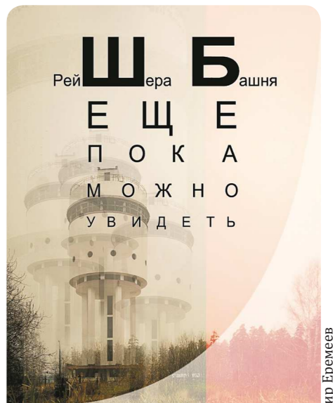
Белую башню также называют башней Рейшера — в честь её архитектора

Регги — далеко не самый популярный музыкальный жанр в нашей стране. Однако и в этой музыке у нас есть такие исполнители, которых слушают даже те, кто относится к направлению скептически. Пожалуй, самый яркий пример — екатеринбургская регги-группа «Alai Oli», музыканты которой, правда, вот уже пять лет живут в Санкт-Петербурге. Живые выступления этой команды всегда собирают полные залы по всей России. Недавно группа отметила 10-летний юбилей большим сольным концертом в родном Екатеринбурге — послушать и поздравить земляков пришло около трёх тысяч человек.